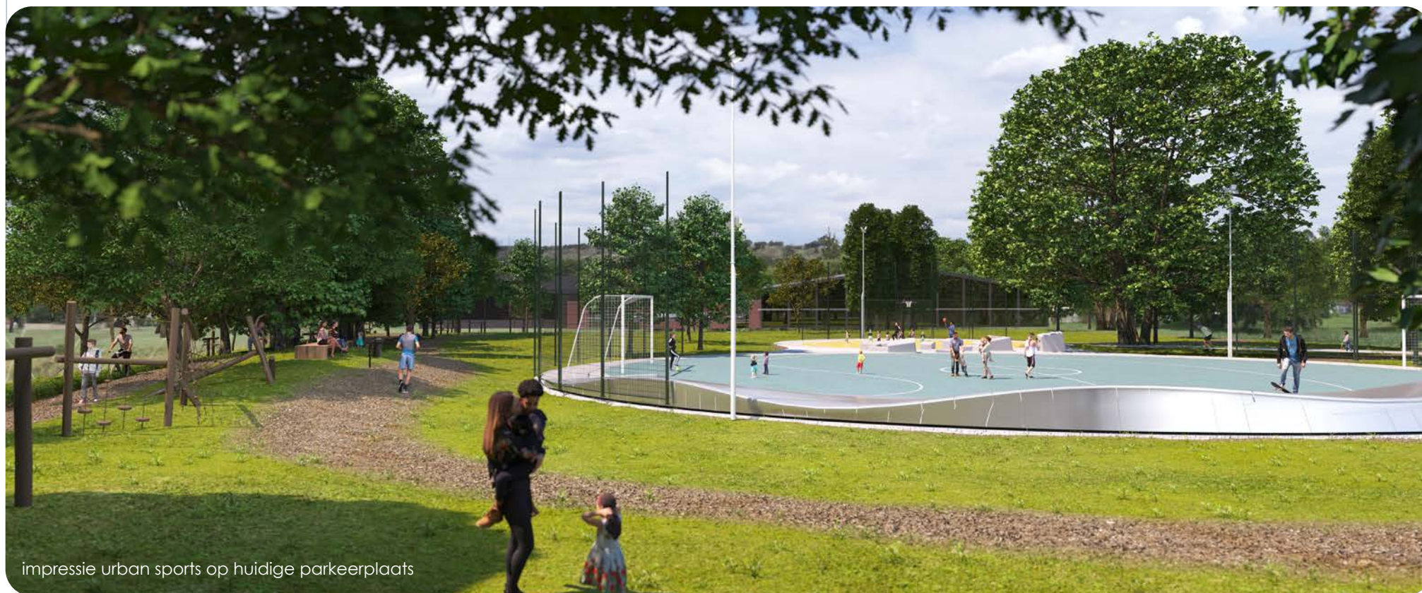
impressie urban sports op huidige parkeerplaats

Het ontwerp bestaat uit ronde verhoogde vormen van asfalt die mogelijkheden bieden om te chillen, te kijken en zeker ook te skaten en skeeleren. In de grote ronding ligt een multicourt voor straatvoetbal. In de kleine ronding een multicourt voor 3x3 basketbal. Op het grensvlak van beide rondingen is een freerun parcours van hergebruikte betonnen en stalen bouwmaterialen. Deze dient tevens als zitplek met uitzicht op de andere sporten.