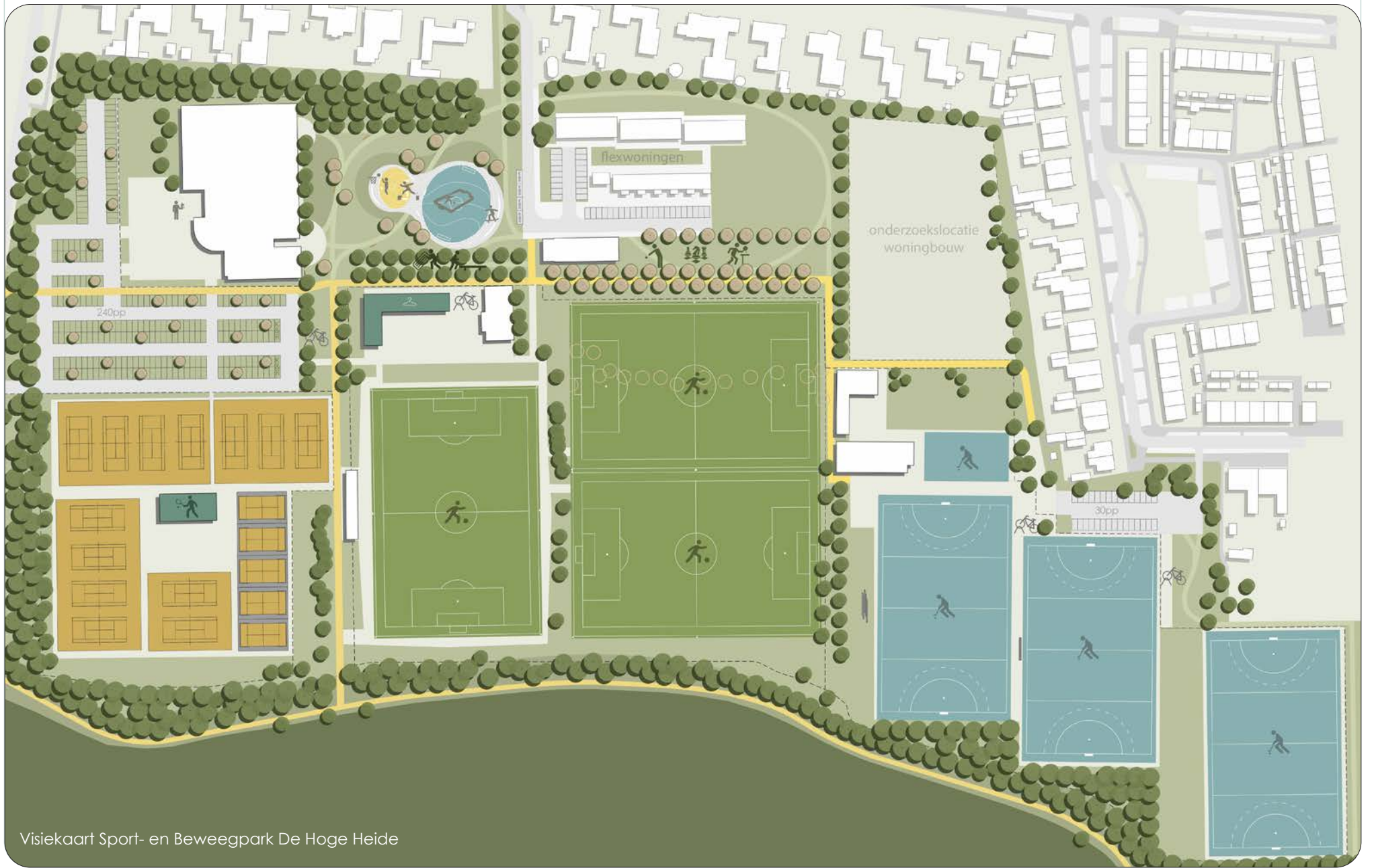
Visiekaart Sport- en Bewegepark De Hoge Heide